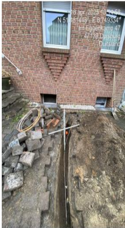
1. Gebauter Trassenverlauf