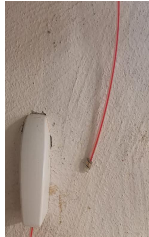
4. Gasdichte Verschlusskappe Mikrorohr