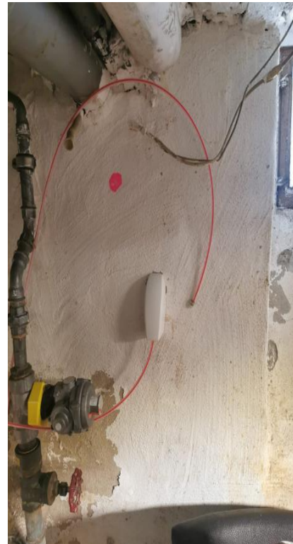
3. Ort des HÜPs im Haus