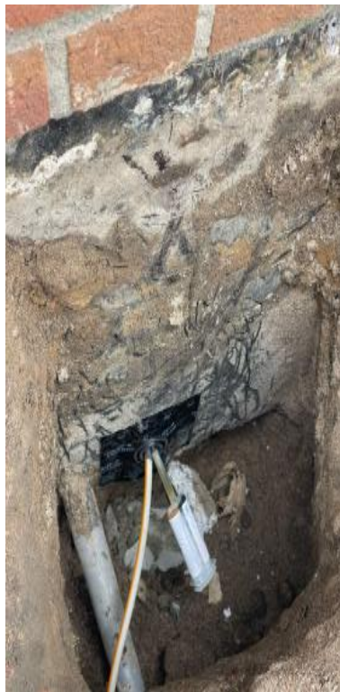
2. Detailaufnahme Ringraumabdichtung (Hauseinführung)